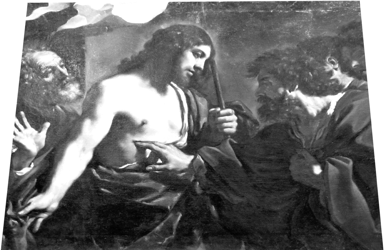
Guercino (1591-1666), Die Ungläubigkeit des heiligen Thomas, 1621

☎ 2171 ☎ 16387 ☎ 4746755 ☎ 804424 ☎ 17595 ☎ 819536 ☎ 819537 ☎ 14855 ☎ 0160-94974328